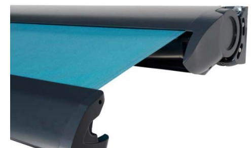
Modèle Tookan - Roche

Le store coffre est un peu le haut-de-gamme du store, il permet aux bras et à la toile d'être rangés dans le coffre de protection. Ce type de store à également l'avantage d'être plus esthétique et moderne en position ouverte et fermée.