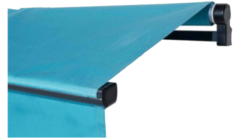
Modèle Horizon - Franciaflex

Appelé aussi store monobloc, il ne possède pas de coffre dans lequel viennent se ranger la toile et les bras articulés. Le store banne traditionnel est donc recommandé lorsque vous bénéficiez d'une avancée de toit qui protégera le store des intempéries. Ce store est adapté aux petits budgets.